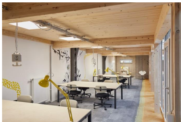
Kreativpark Lokhalle, Bildquelle: Christoph Duepper Photography