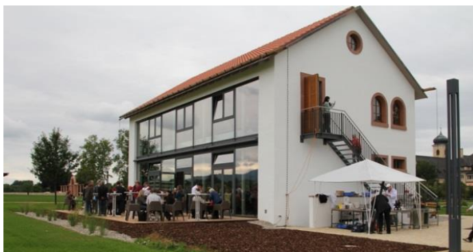
Villa artis, Bilquelle: Stadt Heitersheim