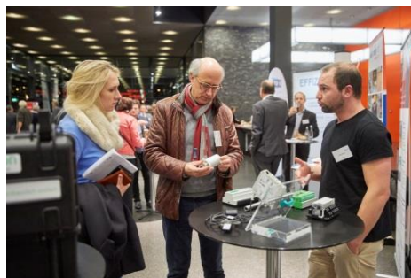
Auftaktveranstaltung „Vernetzte Industrie“ in Offenburg, Bildquelle: Michael Bode