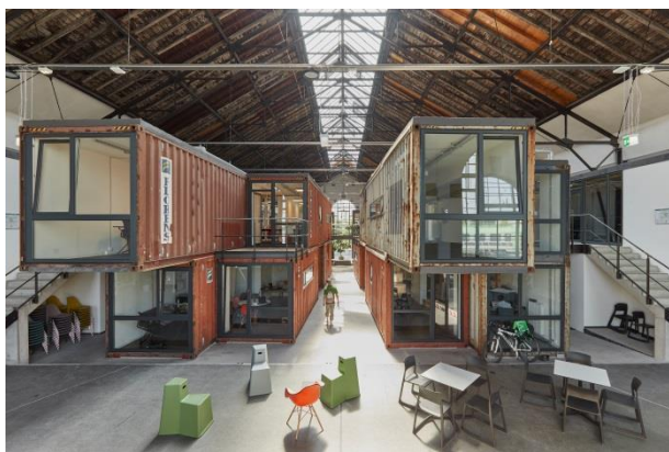
Kreativpark Lokhalle