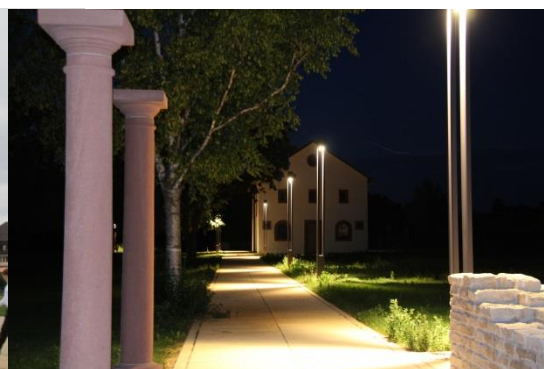
Villa artis bei Nacht