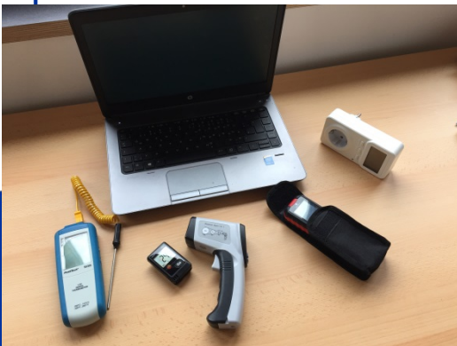
© Energieagentur Böblingen / Messgeräte Begehungen